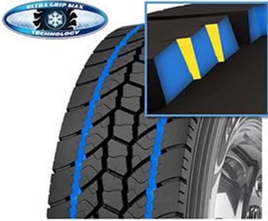
IntelliMax Edge Technology